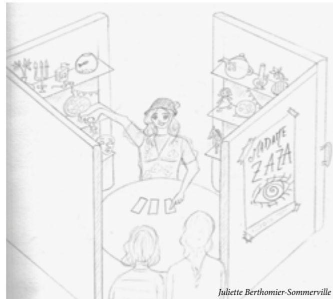
Croquis 3 Les deux valises paravents. Les spectateurs s'appêtent à s'installer dans cette alcôve.

L'objectif est que ces deux paravents soient des modules détachables de la mini-caravane, permettant de conserver la même identité visuelle et le même univers, que la création soit jouée avec ou sans la caravane.