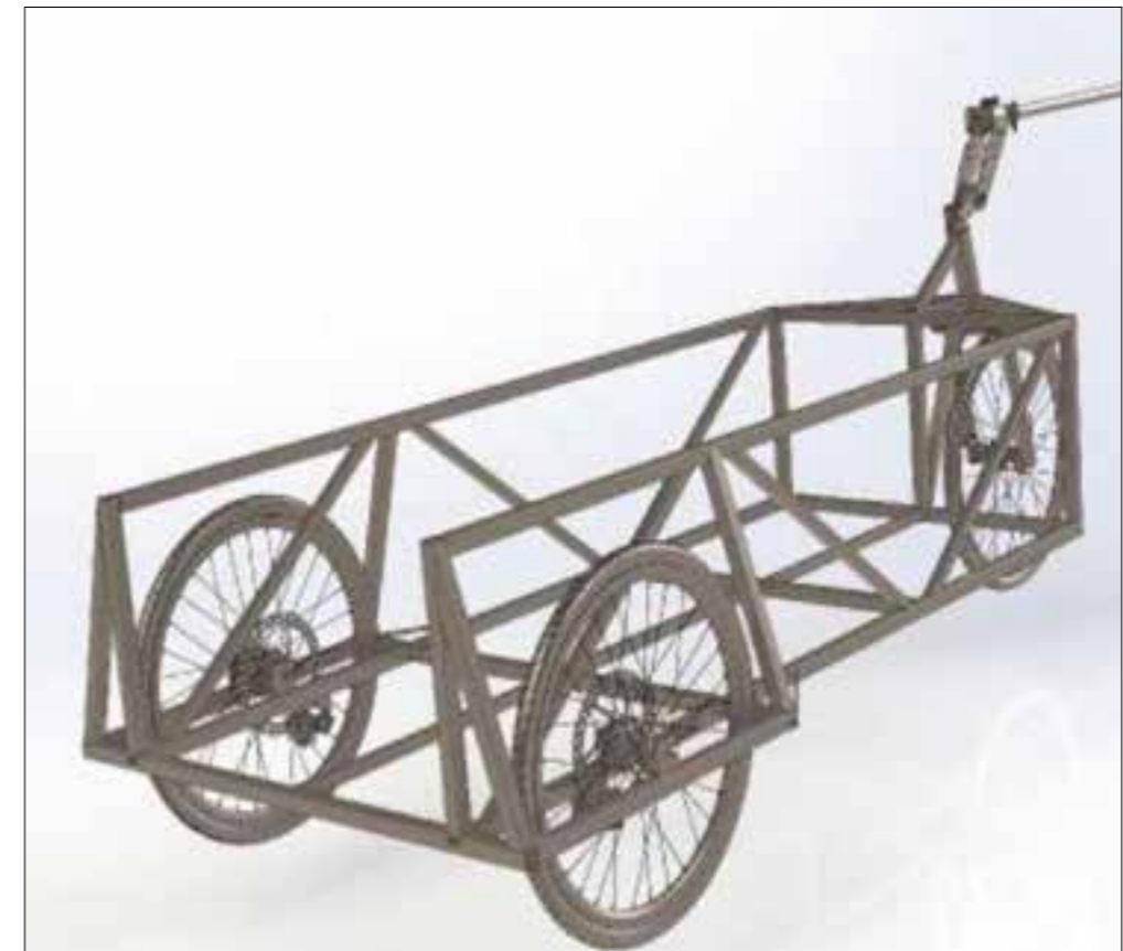
Croquis 1: image extraite du projet Charette (remorque auto freinante à 3 roues, la remorque vélo en open source ).

Sa mobilité est actuellement à l'étude : nous espérons qu'elle puisse être tractée à vélo, une approche en accord avec les enjeux contemporains de déplacement et d'accessibilité. Comme illustré sur le croquis ci-joint, cette modularité permettrait d'arpenter un territoire et d'amener le spectacle au plus près du public.